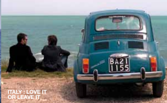
ITALY : LOVE IT OR LEAVE IT